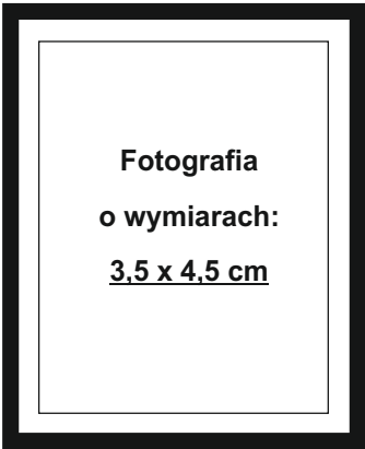
(nie wykraczać poza ramkę wewnętrzną)

Ja, niżej podpisany, uprzedzony o odpowiedzialności karnej za zeznanie nieprawdy lub zatajenie prawdy (art. 233 § 1 k.k.) oświadczam, że moje miejsce zamieszkania znajduje się na terytorium Rzeczypospolitej Polskiej, przy czym że (zaznaczyć właściwe kwadraty literą „X”):